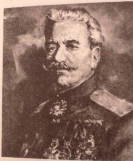
ԱՆԴՐԱՆԻԿ. ԱՆԵՐԿՐՈՐԳ ՀԵՐՈՍ ԵՎ ՉՈՐԱՎԱՐ

նկից լավեց օրգագմի դին կաղկանձը: իրեց հրամանատա-