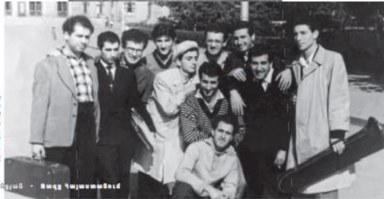
Երևաննախագիծ իմսոխտադրի Նստուղային մյազանքի մի խումբ Երասիլցունի, այնի շրջապատում, 1950-ականների վերջը