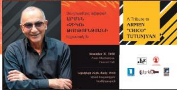
Երևան, 27 նոյեմբերի, 2017 թ., «Մրամ Խաչատրյան» մեծ համերգասրահ